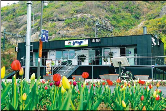
서울 용비쉼터(매점, 화장실) - 부유식 건물